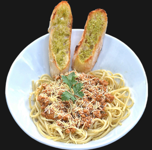
BOLOÑESA - $26.900