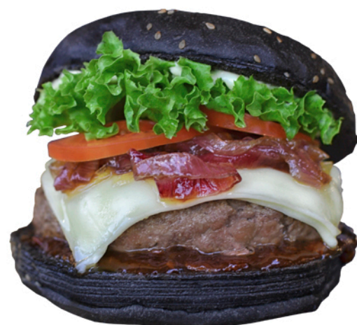
IMAGEN DE REFERENCIA El PAN NEGRO tiene un costo adicional de $2.000

180 gramos de carne (blend de la casa) + Queso mozzarella + Guacamole + Frijol refrito + Plátano maduro + Tomate + Lechuga + Salsa de la casa