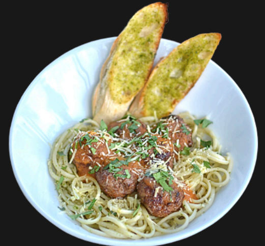
ALBÓNDIGAS - $29.900