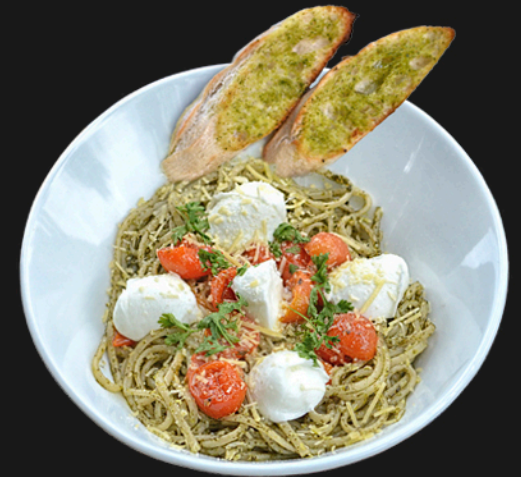
AL PESTO - $29.900