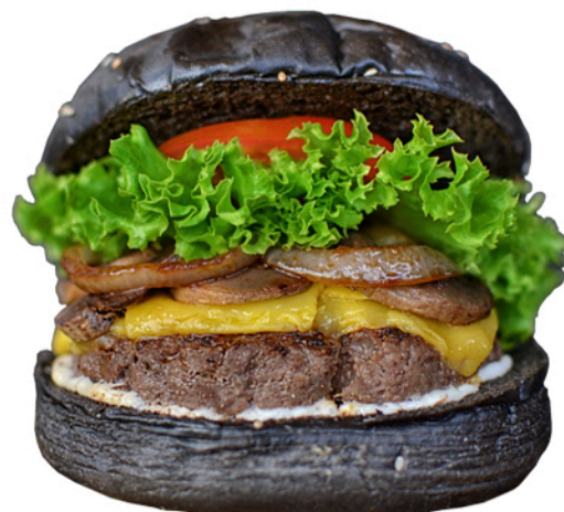
IMAGEN DE REFERENCIA El PAN NEGRO tiene un costo adicional de $2.000

180 gramos de carne (blend de la casa) + Queso mozzarella + Cebolla morada caramelizada en miel de maple y panela + Salsa BBQ 8 18 + Lechuga + Tomate + Mayonesa japonesa