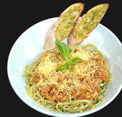
MIXTA - $28.900