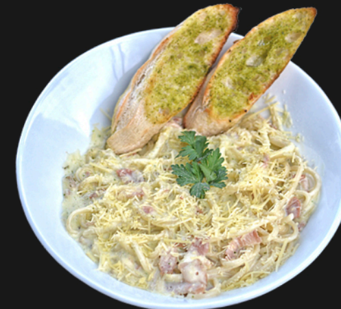
CARBONARA - $29.900