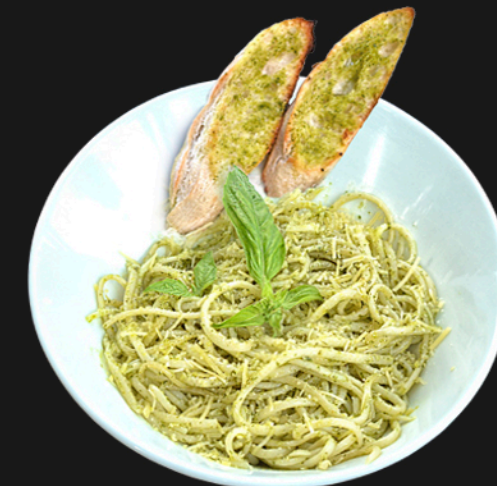
AL BURRO - $23.900