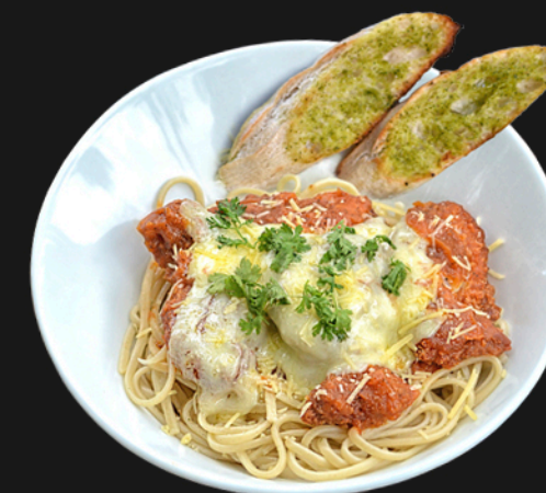
POLLO NAPOLITANO - $31.900